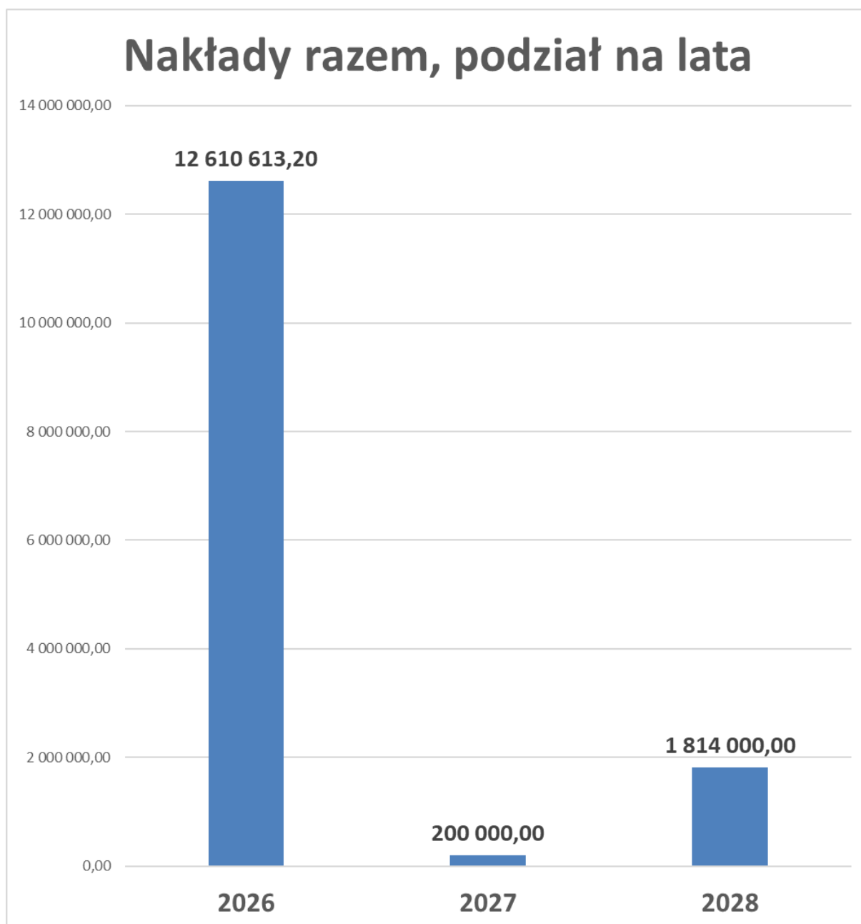
Wykres nr 1