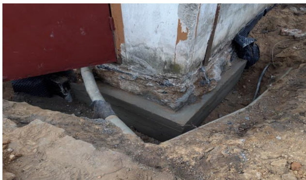
FOTO. Sklamrowane części ścian budynku