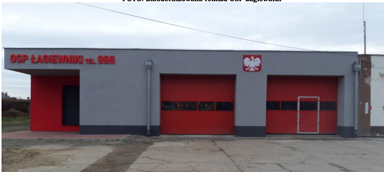
FOTO. Zmodernizowana remiza OSP Łagiewniki