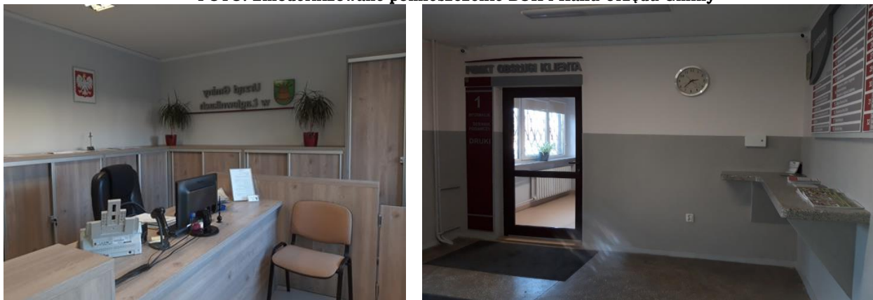
FOTO. Zmodernizowane pomieszczenie BOK i Hallu Urzędu Gminy