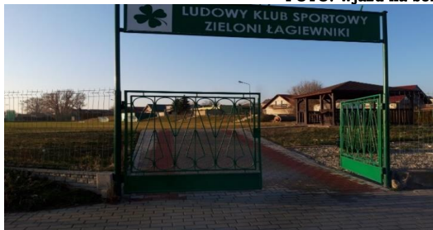
FOTO. Wjazd na boisko sportowe w Łagiewnikach