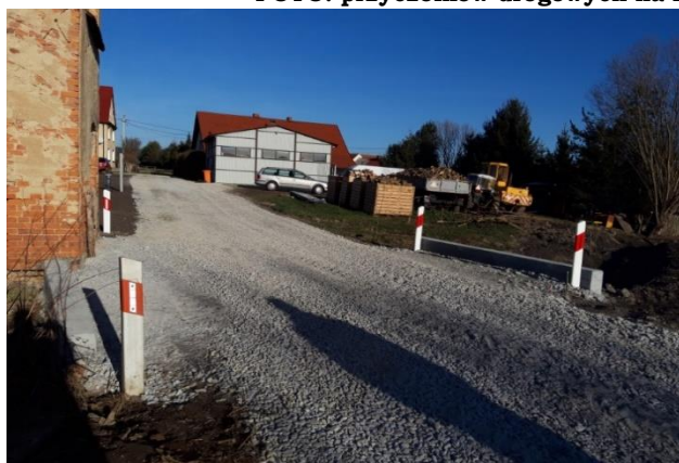
FOTO. przyczółków drogowych na rowach gminnych w Jaźwinie i Stoszowie