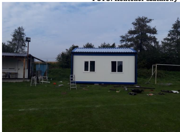
FOTO. Kontener szatniowy na boisku sportowym w Słupicach