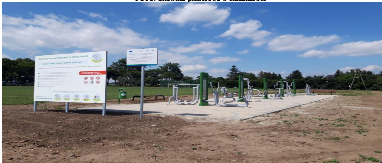
FOTO. Siłownia plenerowa w Radzikowie