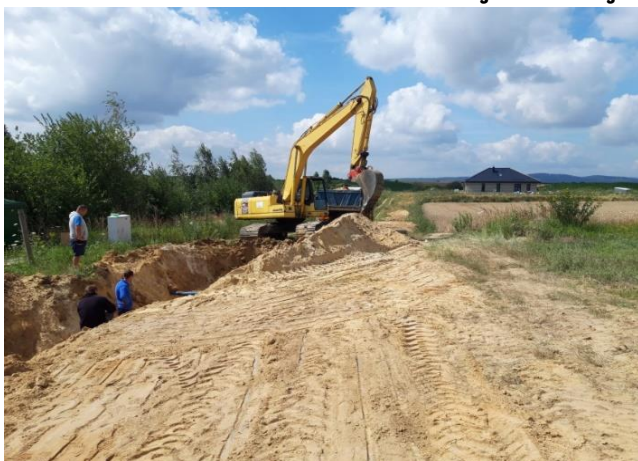
Fot. kanalizacji sanitarnej w ul. Sportowej w Łagiewnikach