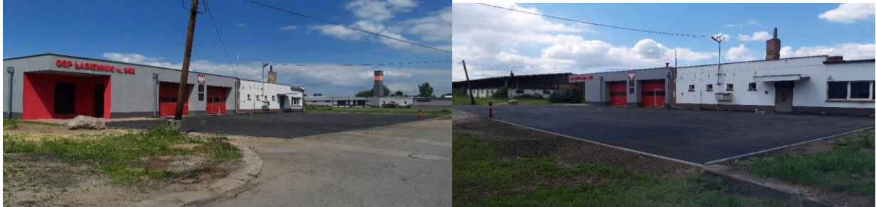
FOTO. Zmodernizowany plac przed remizą OSP Łagiewniki