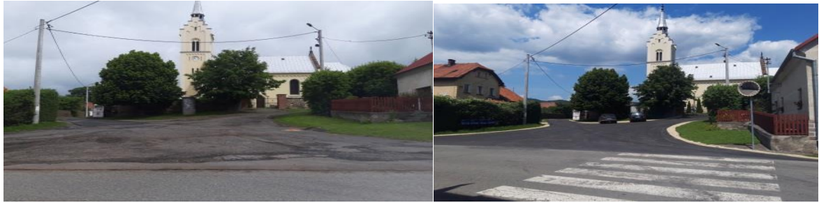
Słupice dz. nr 554 (od Kościoła w dół),