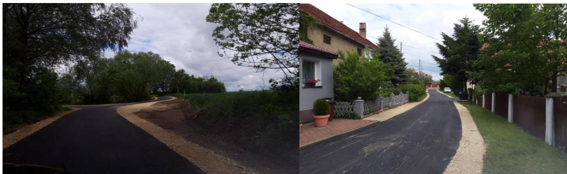
Ratajno dz. nr 41 od dr wojewódzkiej 384.